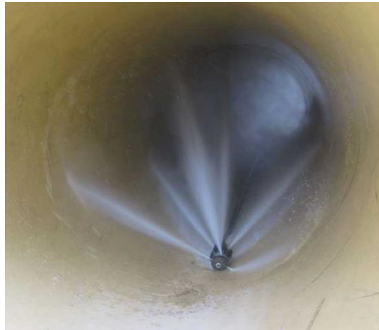
Kanalreinigungsdüse im Einsatz

Zur Beseitigung der Ablagerungen gleitet eine Reinigungsdüse langsam vom Fahrzeug aus durch den zu reinigenden Kanal (Vorschub in Folge austretendem Hochdruckwasserstrahl). Beim anschließenden Zurückziehen der Düse wird das gelöste Material vor der Düse zum Fahrzeug hin transportiert. Dort wird es mit Hilfe eines Saugschlauches aufgenommen.